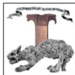
Musei Civici e Pinacoteca "Luigi Sturzo"